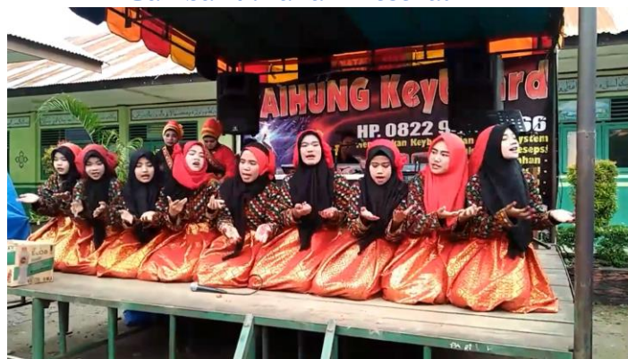
Gambar 4 :Tarian Mesekat

Akhlak ialah sifat yang ada pada jiwa manusia, yang dilakukan tanpa ada pertimbangan maupun pikiran terlebih dahulu (Jaelani, 2020). Nilai Akhlak adalah salah satu dari bagian nilai Islam yang dapat diwujudkan menjadi nyata melalui pengalaman jasmani dan rohani. Akhlak merupakan etika, budi pekerti, moral yang dapat memeberikan seseorang pengetahuan pembeda antara hal yang baik maupun buruk (Oktaviani, 2021). Nilai Akhlak yang ada dalam Tari Mesekat Suku Alas yaitu: