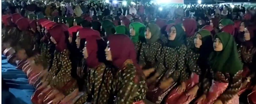
Gambar 1: Tari Mesekat Masal

Pada awalnya tari Mesekat ditampilkan oleh laki-laki, seiring berjalannya waktu tari Mesekat ditampilkan oleh perempuan. Walau begitu dalam penyajiannya tari Mesekat bagi penari laki-laki dan perempuan tidak boleh disatukan. Karena latar belakang adat dan agama melarang laki-laki dan perempuan bersentuhan.