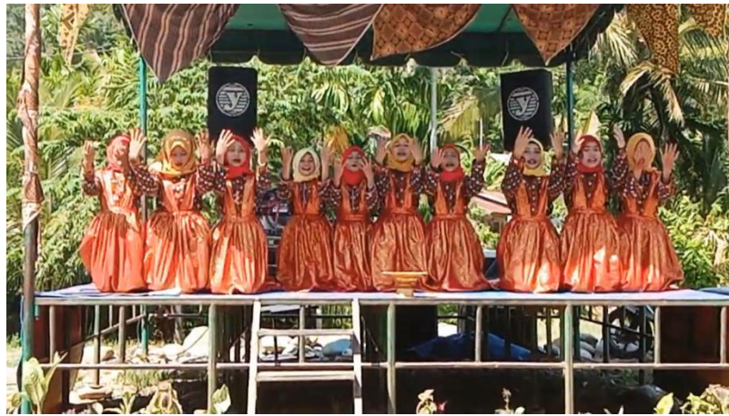
Gambar 2 Tarian Mesekekat

syukur, hormat dan juga sebagai sumber nilai yang utama (Suhra & Rosita, 2020). Berikut nilai akidah yang terkandung dalam Tari Mesekekat Suku Alah ialah :