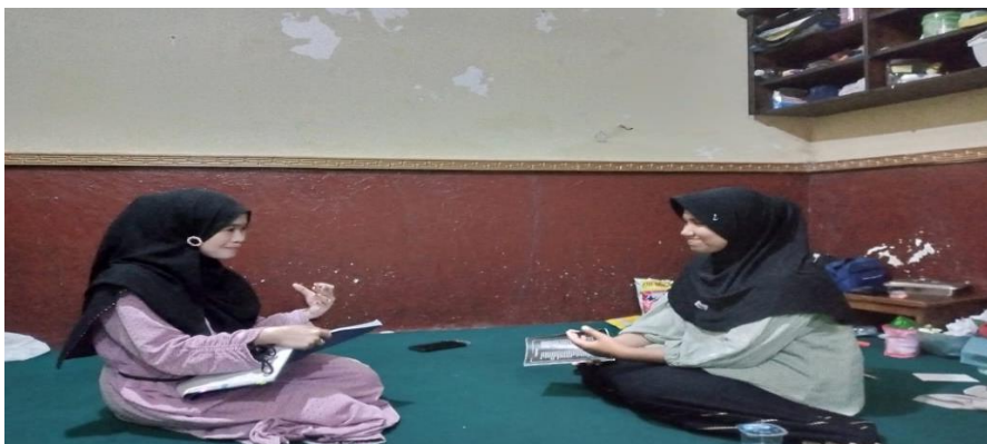
Gambar 1. Wawancara

Berdasarkan hasil observasi, wawancara, dan dokumentasi dapat diketahui bahwa perencanaan kegiatan menghafal Al-Qur'an metode ODOA di Pondok Pesantren Qur'an Tahfidz Centre telah dirancang secara sistematis, terdokumentasi, dan berorientasi pada keberlanjutan serta kesiapan individu santri. Perencanaan ini mengedepankan prinsip adaptabilitas target, dengan menetapkan satu ayat per hari sebagai ritme optimal bagi santri usia 7-10 tahun, serta memberikan fleksibilitas penambahan ayat atau halaman bagi santri di atas 10 tahun sesuai kapasitas masing-masing. Program ini juga menerapkan mekanisme seleksi berbasis kompetensi, dimana hanya santri yang telah menyelesaikan tahap pra-menghafal (lancar makharijul huruf dan tajwid) yang diperkenankan mengikuti metode ODOA. Penguatan retensi hafalan dijamin melalui alokasi rutin muraja'ah sebanyak setengah juz per hari, sementara konsistensi pelaksanaan ditopang oleh pendampingan intensif ustadzah dan pencatatan progres harian. Keselarasan antara temuan observasi, pernyataan narasumber, dan dokumen pendukung (program kerja, jadwal, kartu monitoring, dan panduan teknis) mengonfirmasi bahwa perencanaan metode ODOA tidak hanya bersifat konseptual, melainkan telah terstruktur dalam pedoman operasional yang jelas, terukur, dan siap diimplementasikan secara konsisten di lapangan.