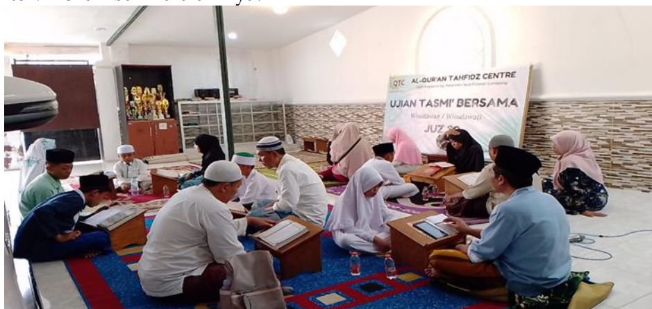
Gambar 3. Pelaksanaan Ujian Tasmi' sebagai evaluasi pencapaian santri

"Evaluasi setiap hari dilakukan oleh pengasuh, dalam hal ini dilakukan oleh Kyai. Karena semua setoran dan muraja'ah harus kepada Kyai, diluar muraja'ah yang dilakukan berpasangan oleh santri. Biasanya di pondok akan dilakukan wisuda, tapi tidak setiap tahun. Melihat prestasi santri yang sudah mencapai target hafalan nya. Karena sebelum di wisuda santri harus melewati tasmi' sesuai jumlah hafalannya. Sejah ini, metode ODOA ( One Day One Ayat ) sangat membantu santri yang masih kecil untuk menambah hafalan nya."