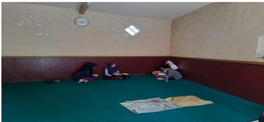
Gambar 2. Murojaah Berpasangan

Berdasarkan dokumentasi lapangan di atas, terlihat suasana pelaksanaan muraja'ah berpasangan yang menjadi bagian operasional dari metode ODOA di Pondok Pesantren Qur'an Tahfidz Centre. Beberapa santri duduk bersila di atas karpet hijau dalam ruang tahfidz yang tenang dan minim distraksi, dengan sepasang santri tampak saling menyimak dan mengoreksi bacaan satu sama lain sesuai dengan porsi dan tingkat hafalan masing-masing. Kondisi visual ini mengonfirmasi temuan wawancara yang menyatakan bahwa muraja'ah tidak hanya bersifat individual, melainkan juga difasilitasi melalui sistem kolaboratif yang disesuaikan dengan volume hafalan santri. Penataan ruang yang sederhana, kehadiran jam dinding sebagai penanda alokasi waktu, serta postur fokus santri mencerminkan penerapan jadwal terstruktur (pagi, sore, malam) yang telah dirumuskan dalam perencanaan program. Secara pedagogis, interaksi berpasangan ini berfungsi sebagai mekanisme peer-monitoring yang memperkuat akurasi tajwid, mempercepat retensi memori jangka panjang, dan membangun kebiasaan spiritual yang konsisten. Dokumentasi tersebut secara empiris memperkuat temuan bahwa pelaksanaan ODOA di pesantren ini tidak sekadar mengejar target setoran harian, melainkan dioperasionalkan melalui ekosistem pengulangan yang terukur, adaptif terhadap keberagaman santri, dan berorientasi pada keberlanjutan hafalan.