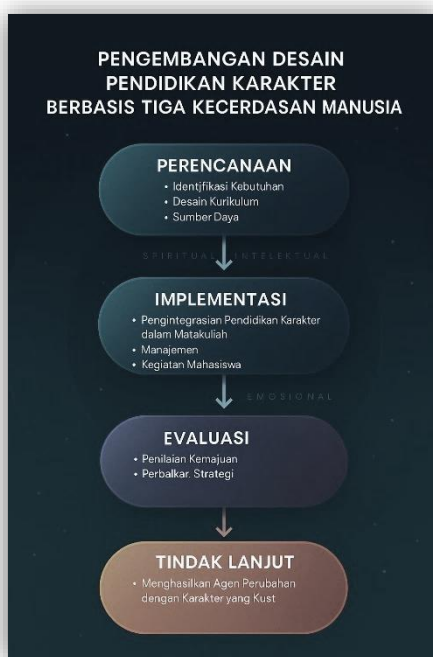
Gambar 1. Rancangan Pengembangan Desain Pendidikan Karakter

Penelitian ini mengisi gap yang ada dengan mengembangkan model pendidikan karakter yang berbasis pesantren, yang tidak hanya mengintegrasikan kecerdasan intelektual dan emosional, tetapi juga kecerdasan spiritual. Dengan pendekatan ini, penelitian ini akan memberikan kontribusi baru dalam pendidikan karakter di perguruan tinggi, terutama dalam konteks pendidikan Islam yang berbasis pada nilai-nilai luhur pesantren. Selain itu, hasil dari penelitian ini dapat menjadi referensi bagi pengembangan model pendidikan karakter di institusi pendidikan tinggi yang lebih luas.